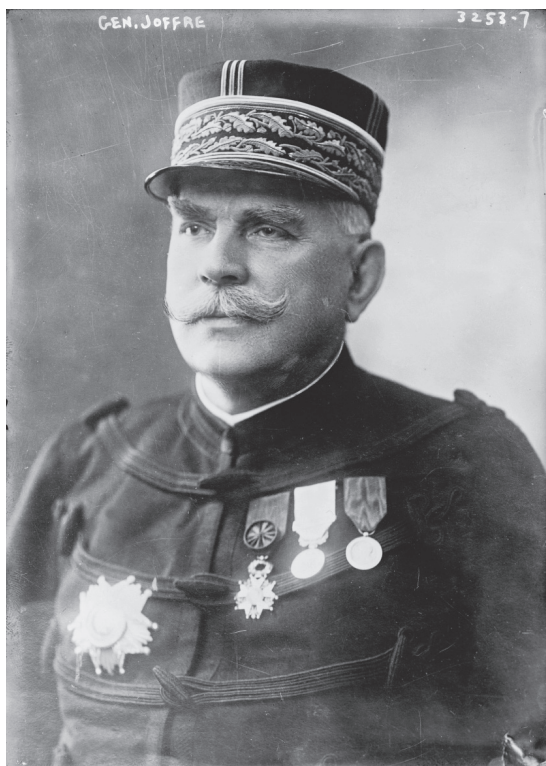
Генерал Жозеф Жофр, командващ френската армия от 1911 до 1916 г.

Жокерът в съотношението на силите е британската армия. Основният въпрос е дали тя ще се появи. Макар да са водени разговори между щабовете на Великобритания и Франция, те са останали в тайна от публичното пространство и дори от почти всички, с изключение на малцина политически лидери на Великобритания. Вторият основен въпрос е за качеството на британските войски. В действителност те ще се окажат най-добре обучените пехотинци от всички европейски армии през 1914 г. Германците ще открият, че британската пехота е изключително добре подготвена и способна да причини изключително много смъртоносни щети с техните пушки „Лий–Енфилд“.