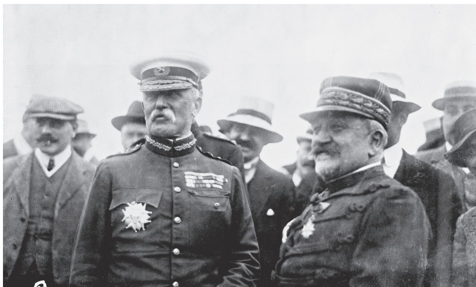
Фелдмаршал сър Джон Френч, командир на Британския експедиционен корпус, 1914 г.

Когато Британският експедиционен корпус (BEF) се придвижва отляво на Пета армия на Ланрезак, командирът му фелдмаршал сър Джон Френч се среща с командира на съседната му армия. Срещата е пълна бъркотия. Британският фелдмаршал едва говори френски, а и Ланрезак не знае почти нищо на английски. Тъй като и щабовете им не са по-добре подготвени за разговор на езика на съюзника, двамата генерали използват подхода, който американските туристи са склонни да прилагат при подобни обстоятелства: те говорят много бавно и много високо и не разбират почти нищо от това, което другият казва. Това предсказуемо води до минимална координация, да не говорим за много по-слабо коор-