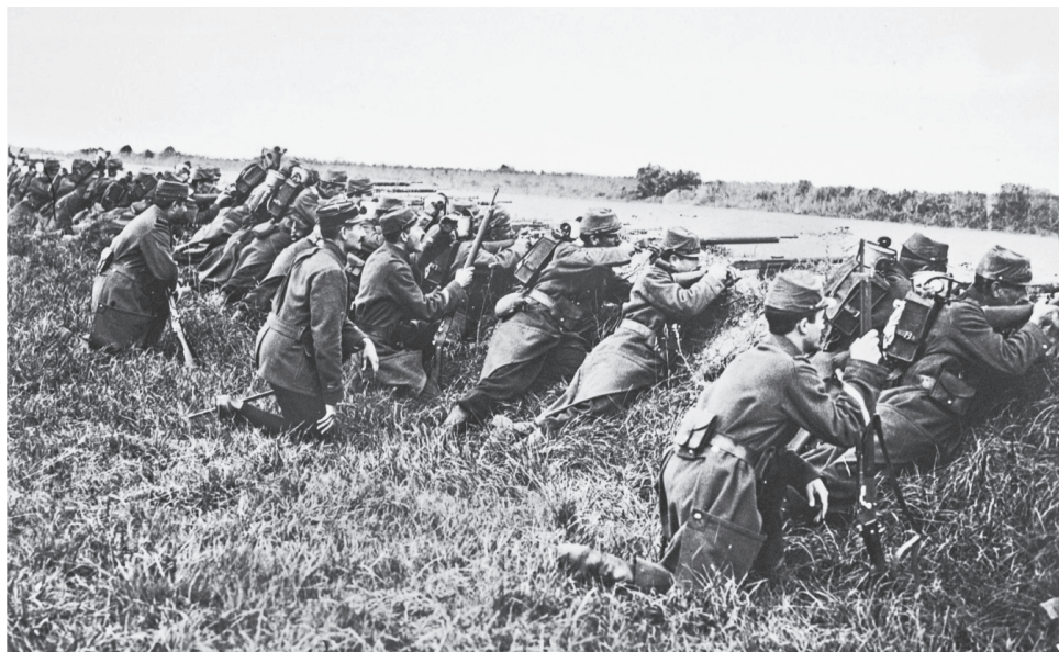
Френска стрелкова линия. Library of Congress, Washington, D.C.

французите при опита им да се врежат в ариергарда на армията на Клок. Този успех на отбраната слага край на шансовете на френската Шеста армия да унищожи Първа германска армия.