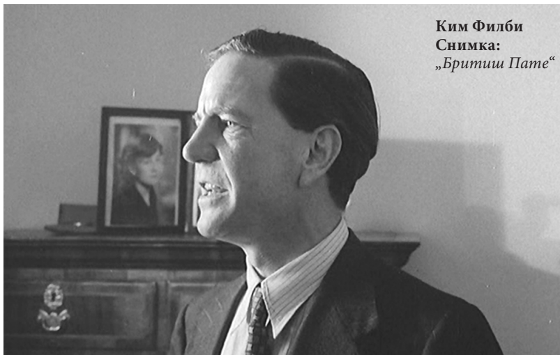
Ким Филби

и съюзниците му, че в крайна сметка нацистите губят войната. Акциите им и до днес се изучават в учебниците като пример за брилянтно проведени свръхизобретателни разузнавателни акции.