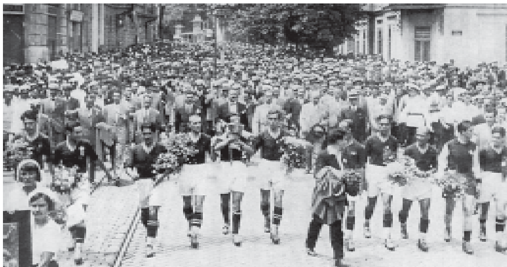
Посрещането на българския национален отбор с балканската купа през 1932 г.