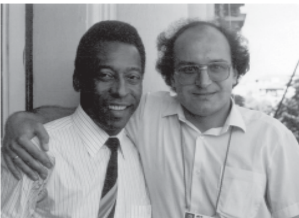
Авторът с Пеле през 1990 г. в Рим...

първенства“, „Вечното дерби „Левски“ – ЦСКА“. А неговата „Световна футболна енциклопедия“, която е истинска библия от „А“ до „Я“, вече има своето четвърто издание след книгата през 2001 и 2005 г. и компакт-диска през 2004 г. Съавтор е на книгите „Левски“ – всичко за любимия отбор“ и „Това е ЦСКА!“ В продължение на осем години авторът преподава спортна журналистика към НСА. Посетил е 75 страни и на шестте континента, стъпил е на най-големите стадиони в света начело с легендарния „Маракана“ в Рио де Жанейро. От петнайсет години заедно с ко-