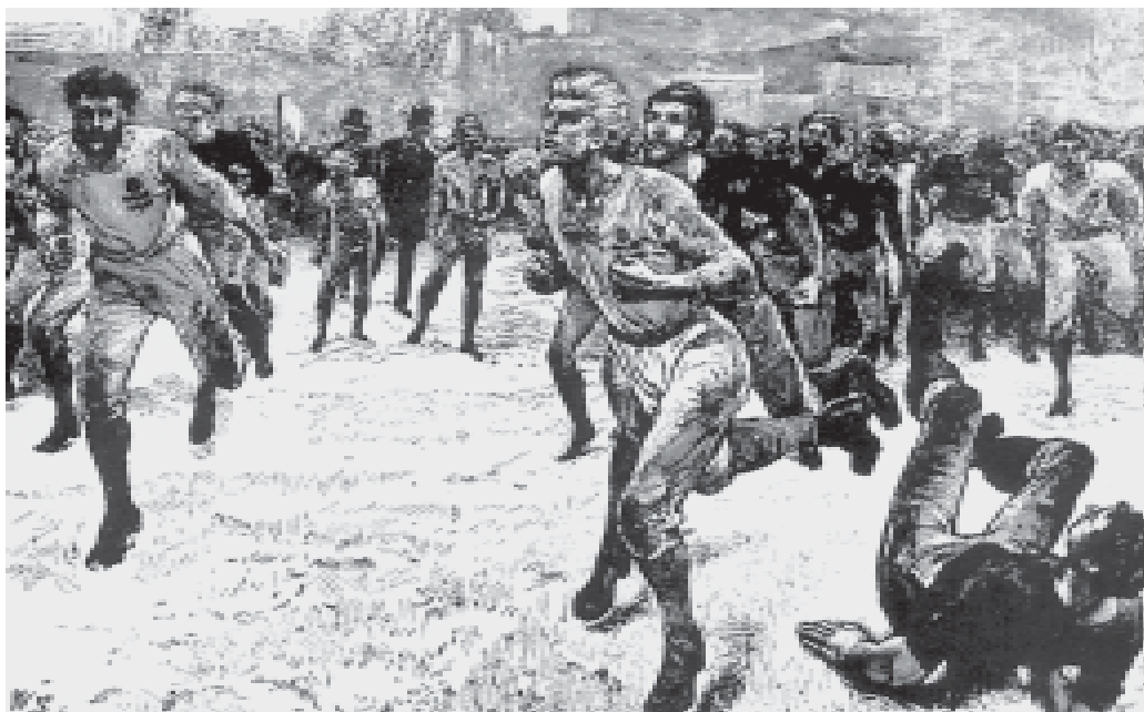
Първият мач между национални отбори в историята: Шотландия – Англия 0:0 през 1872 г.

рите на игрището – то не може да бъде по-дълго от 200 и по-късо от 100 ярда (182 на 91 м). Стълбовете на вратите са на разстояние 8 ярда (7,32 м) един от друг, но без напречна греда.