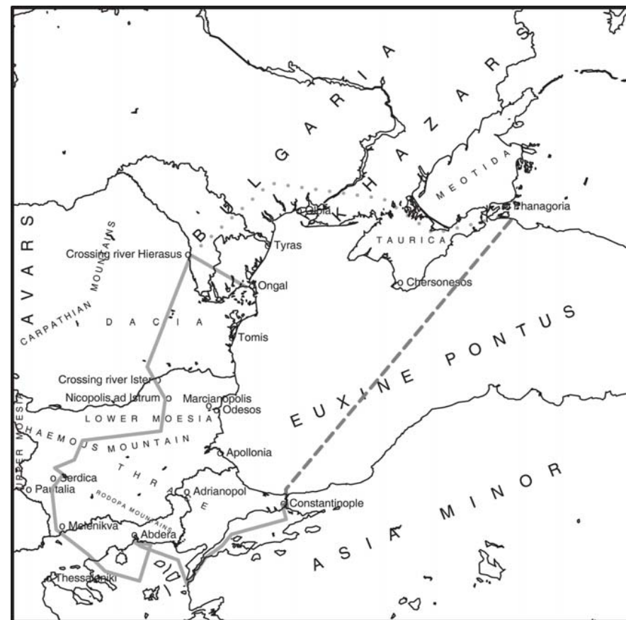
A. Маршрутът, следван от Аспарух и неговите спътници