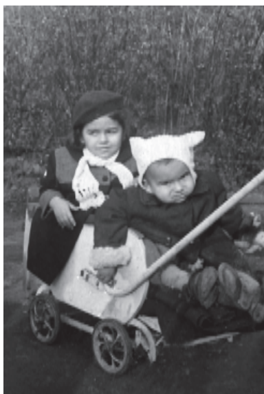
Вече съм усмихнат с познатата чаровност...