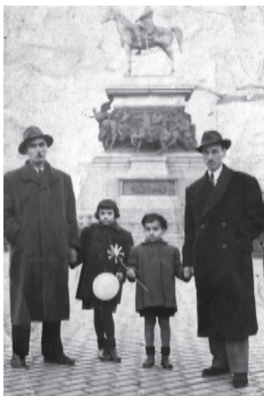
На жълтите павета с татко, сестра ми и чичо ми

В София беше бедно и студено. Нямаше парно. Аз ходех с дълги рипсени чорапи и жартиери. Имах и презрамки с еделвайс.