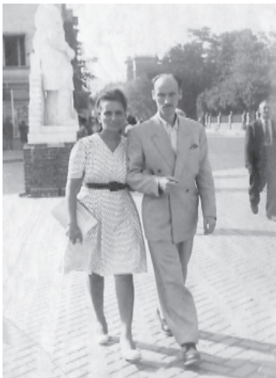
Баща ми и майка ми