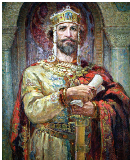
Димитър Гюдженев. „Цар Симеон I“

ГЮДЖЕВ Димитър Атанасов (26.I.1891–25.VIII.1979) – живописец и педагог. Роден в Стара Загора. Син на Атанас Гюдженев. Учи живопис в Държавното художествено-индустриално училище в София (1910–13) при Цено Тодоров, в Националното училище за изящни изкуства в Париж (1913–14) при Феликс Кормон, завършва (1915) Художествената академия в София при Иван Мърквичка. Член-основател на Дружеството на южнобългарските художници, член на дружество „Съвременно изкуство“ (от 1920), член (от 1929) и председател (1931–41) на Съюза на дружествата на художниците. Творческата си дейност започва като сценограф. Заедно с Никола Кожухаров създава (1914) за театъра в Стара Загора завеса гилотина, върху която изобразява Аполон и музите. В началото на 20 в. рисува декори за различни читалищни сцени. Като военен художник по време на Първата световна война 1914–18 рисува картини, които разкриват жестокия лик на войната – „Обоз на път“ (1916), „През Мо-