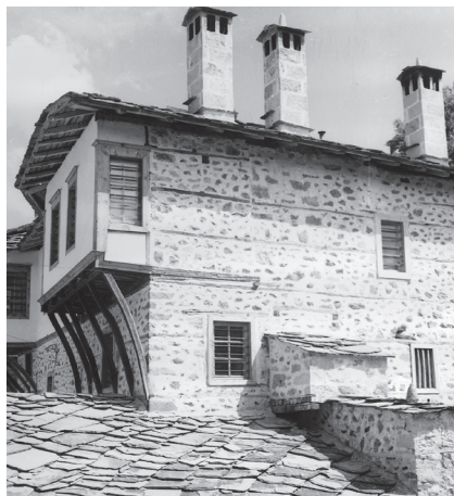
Гърджевата къща в Смолян

ГЪОРДЖЕВАТА КЪЩА в Смолян – възрожденска къща в квартал Райково от типа на родопските братски къщи. Паметник на културата. Строена е за братя Гърджеви и обединява две самостоятелни жилища (раз-