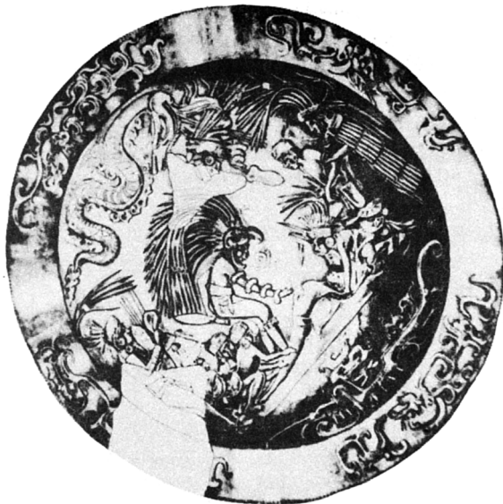
Златен диск, изваден от Свещения кладенец, със сцена на човешко жертвоприношение