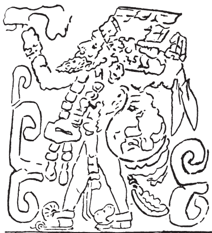
„Брадацият“ Кукулкан от Чичен Виехо

вод означава „писане в мрак“ (или в мъгла). Не е трудно да се разбере защо.