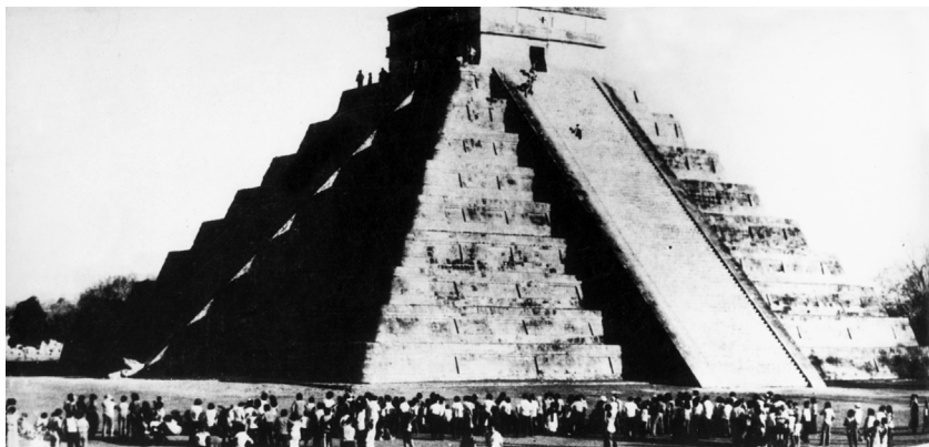
Кукулкан слиза от небето по северната страна на пирамидата в Чичен Ица. „Явлението“ в дните на пролетното и есенното равноденствие останало скрито за испанските завоеватели

Посрещачите са вцепенени. Никой не помръдва. Пернатата змия не бива да се безпокои по време на краткия ѝ престой. Не поглеждам часовника. Не мога да кажа секунди или минути продължи тази невероятна гледка. Виждам, че Кукулкан вече си тръгва. Първо „загасва“ змийската глава. Блестящата ивица започва да се отдръпва към върха на пирамидата и изведнъж изчезва. Замина си така неочаквано, както и пристигна.