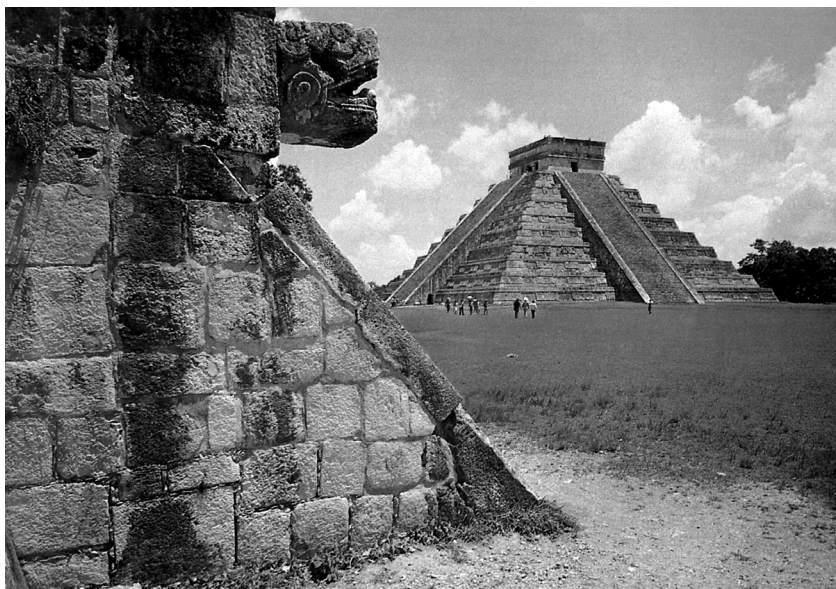
Пирамидата на Кукулкан, Чичен Ица

книги или пък може да надникне върху тези редове, бих искал да го запитам: „Ти виждал ли си бог да слиза от небето? Аз – да!“.