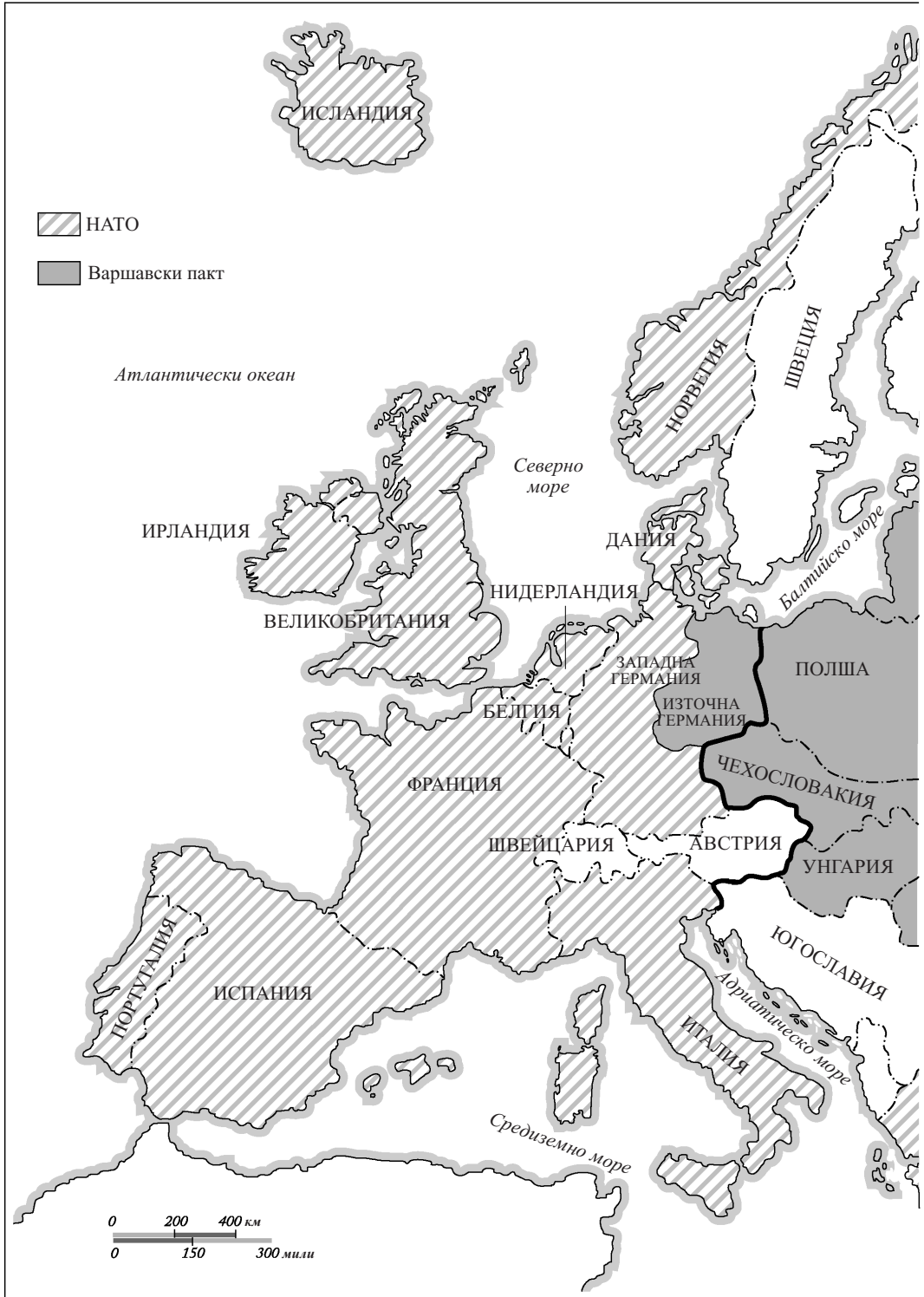
1.1 Разделението на Европа по време на Студената война