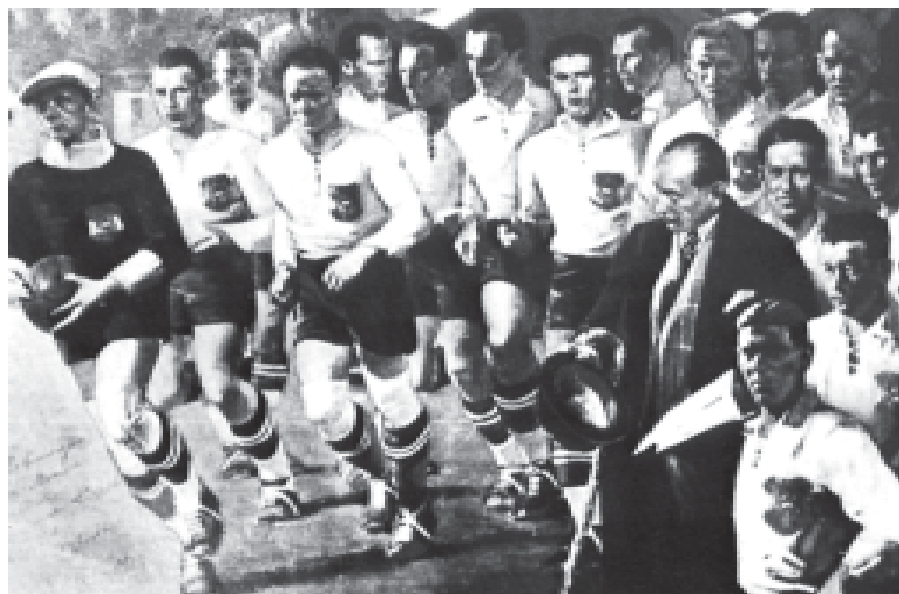
Австрийският „Вундертим“ през 30-те години

Държава в Централна Европа с площ 83 850 кв. км и население 8 102 000 жители, столица Виена. Футболната федерация е основана през 1904 г., член на ФИФА от 1905 г., а на УЕФА от 1954 г. Международен дебют през 1902 г. срещу Унгария 5:0. Първи шампионат през 1927 г. – победител „Адмира Вакер“. Международни успехи: трето място на СП през 1954 г., четвърто място на СП-34, второ място на ОИ-36, юношески първенец на Европа през 1950 и 1957 г. Най-добрите години са краят на 20-те и началото на 30-те, когато е ерата на прочутия „Вундертим“ със Синде-