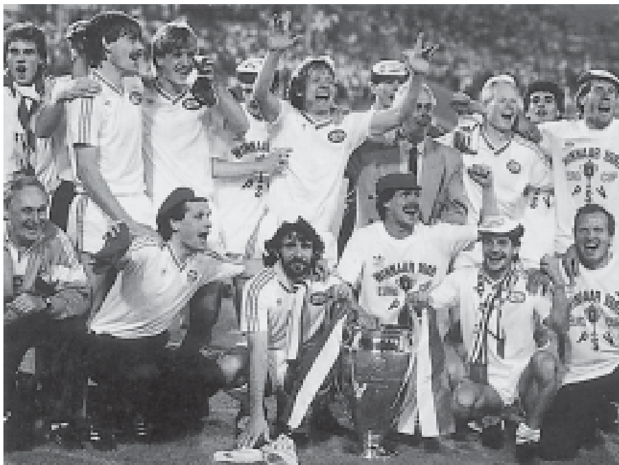
Отборът на „Айнхховен“ – носител на КЕШ през 1988 г.