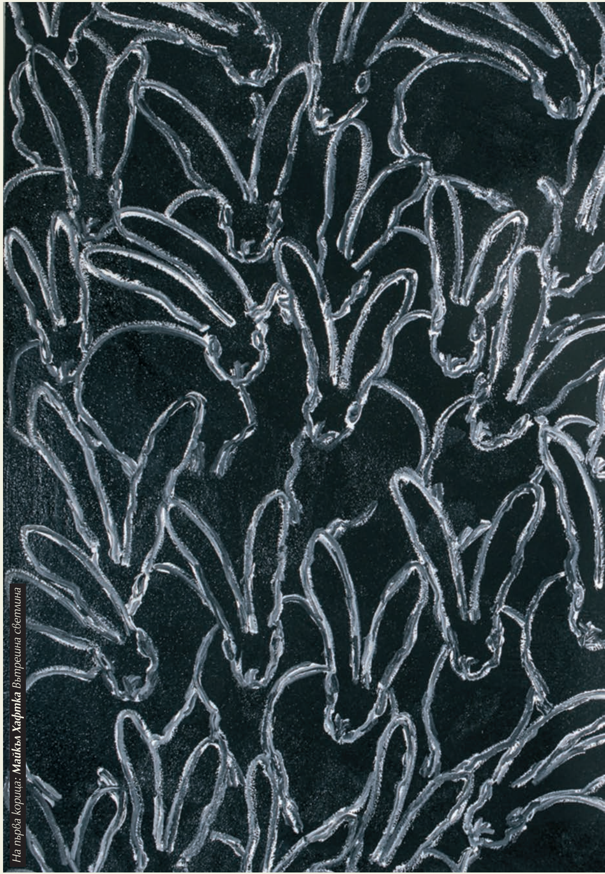
На първа корица: Майкъл Хафлика Вътрешна светлина