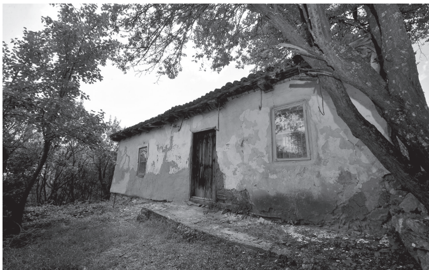
Запазената старинна постройка в двора на семейство Рангелови в село Беренде