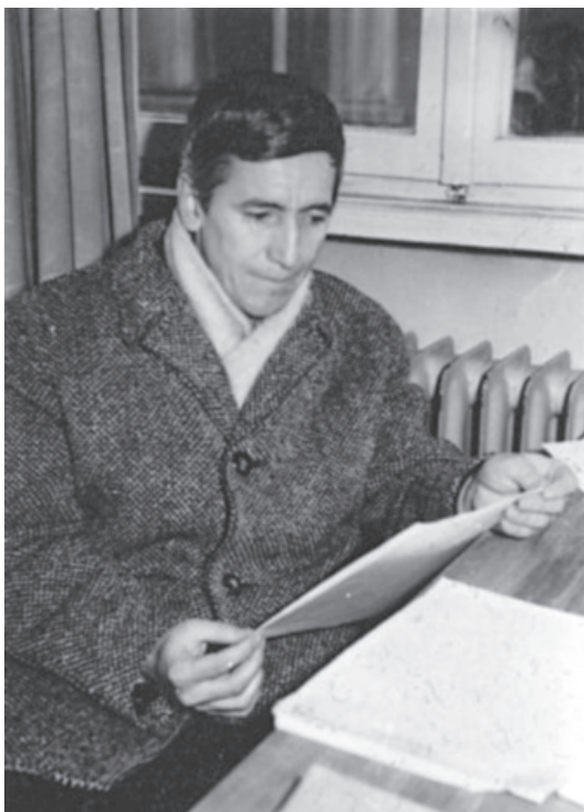
Младият писател Георги Марков в редакцията на издателство „Народна младеж“