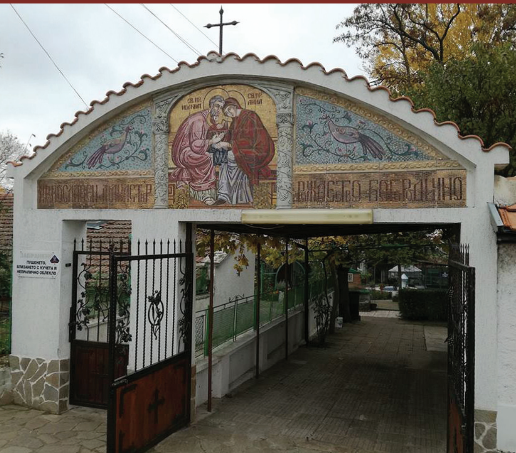
Входните врати на Кабиленския манастир