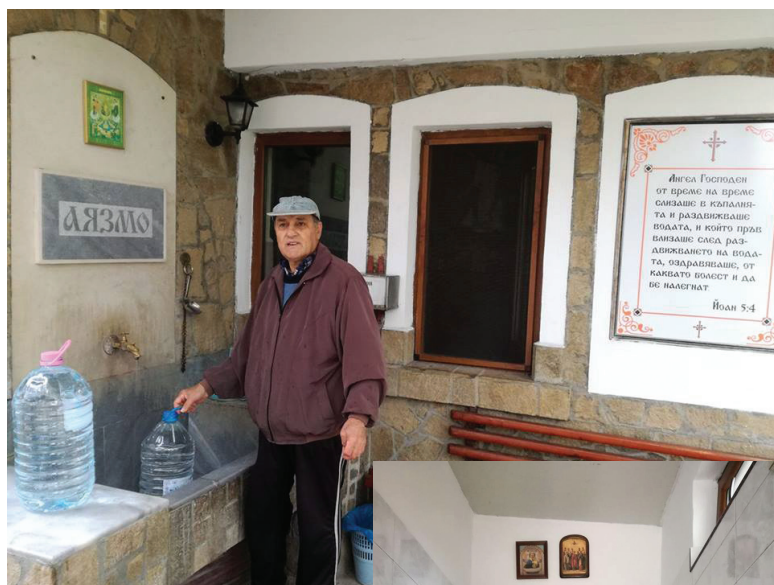
Всеки ден хора пълнят туби с вода от лековития извор