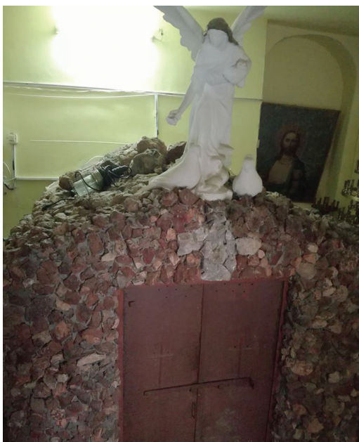
Аязмото. Тук извира чудодейната вода