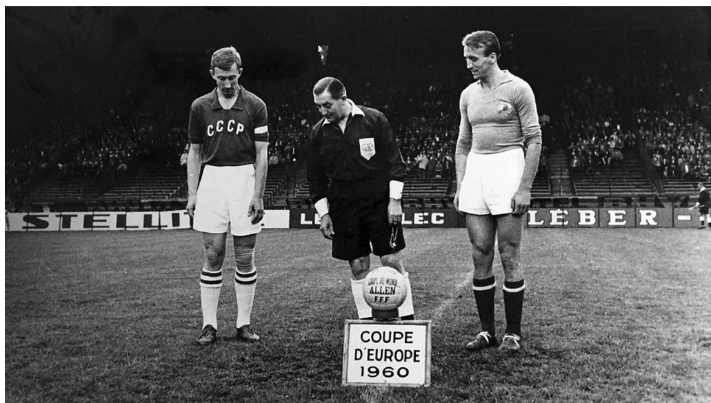
Капитаните на СССР и Югославия Игор Нето (вляво) и Бора Костич минути преди началото на финалния мач на „Евро '60“