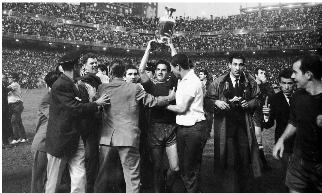
Испанците ликуват с първата си европейска купа

738 на „адзурите“, съставена от имена като Чезаре Малдини, Трапатони, Факети и Гуарнери, е подложена на изпитание. Още до почивката СССР води с 2:0 и този резултат се запазва до края. Препълненият Олимпийски стадион в Рим с мощен рев призовава „скуадрата“ в атака, но домакините срещат добре организираната съпротива на тима на Бесков.