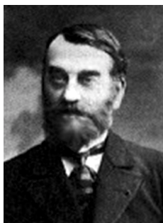
Пол Видал дьо ла Блаш

Врангел , Фердинанд Петрович (1797–1870) – руски адмирал и мореплавател. Роден в Псков. Участва в околосветското плаване на Василий М. Головин (1817–1819). От 1820 до 1824 г. с ръководената от него експедиция изучава северните брегове на Сибир, също и остров, наречен по-късно на негово име Врангел. Изследва и северозападните части на Северна Америка и е управител на руските селища там. Обявява се против продажбата на Аляска на САЩ.