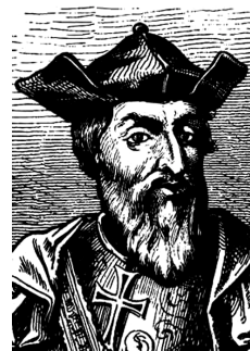
Вашку да Гама