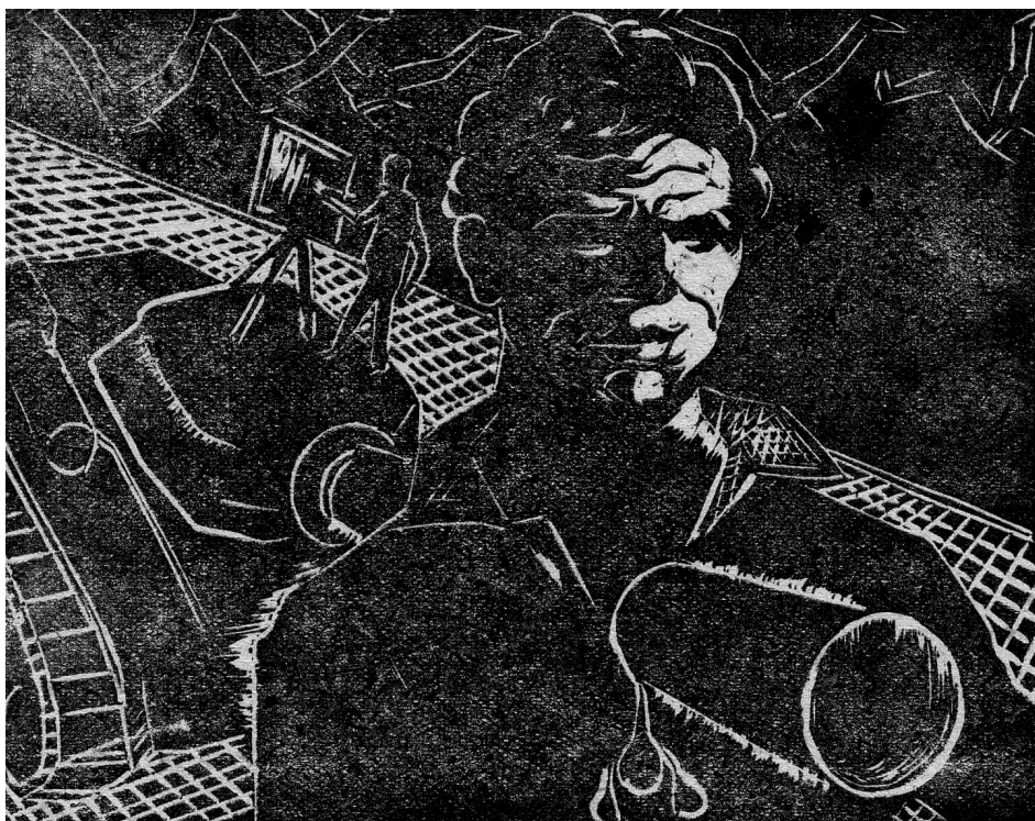
Автопортрет, линорез, 1961

С огромна любов и старание необразованият юноша навлиза с бързи стъпки в тайните на рисунката. Един ден това ще се окаже най-силното му оръжие. Само две години по-късно ще напише от казармата на приятеля си: „Коле, не се подценявай в рисуването, рисувай творчески. Понякога малките, дребни, едва забележими неща стават велики. Но трябва смелост, за да се отправим към незначителното. Рисувай повече на малък формат и много разучено“.